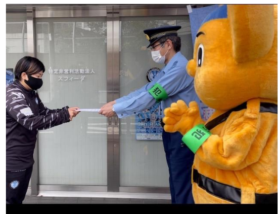
↑ 委嘱状交付の様子